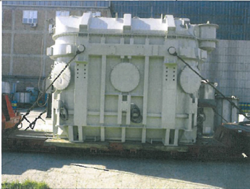
Slika 2: Remontovan blok ET za HE Bajina Bašta pripremljen za transport